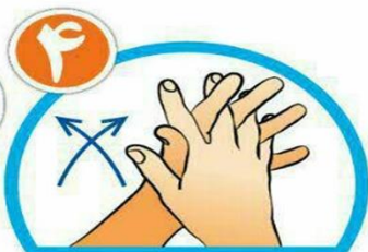
بین انگشتان را از روبرو بشویید.