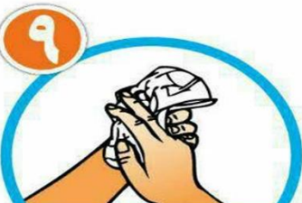
دست ها را با دستمال خشک کنید.