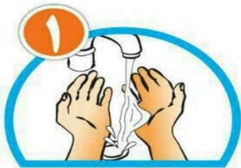
دست ها را خیس کرده و بعد آن ها را صابونی کنید.