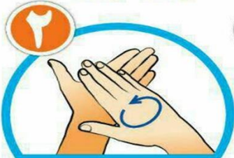
کف دست ها را با هم بشویید.