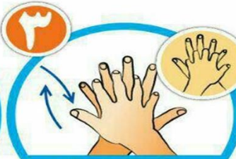
بین انگشتان را در قسمت پشت بشویید.