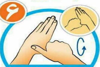
شست ها را جداگانه و دقیق بشویید.