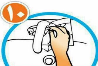
با همان دستمال شبر آب را ببندید و دستمال را در سطل زباله بیاندازید.