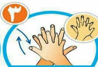
بین انگشتان را در قسمت پشت بشویید.