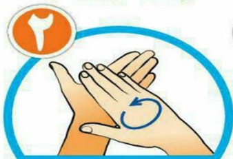
کف دست ها را با هم بشویید.