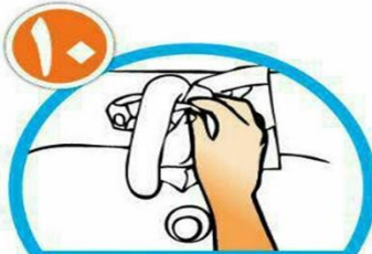
با همان دستمال شبر آب را ببندید و دستمال را در سطل زباله بیاندازید.