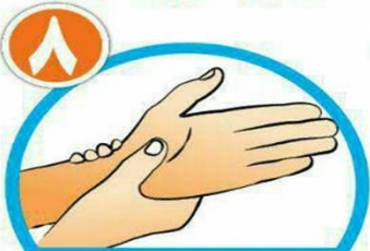
دور مچ هر دو دست را بشویید.