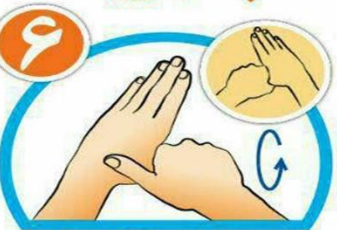
شست ها را جداگانه و دقیق بشویید.