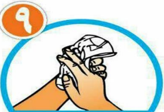
دست ها را با دستمال خشک کنید.