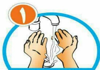
دست ها را خیس کرده و بعد آن ها را صابونی کنید.