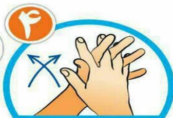
بین انگشتان را از روبرو بشویید.