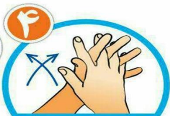
بین انگشتان را از روبرو بشویید.