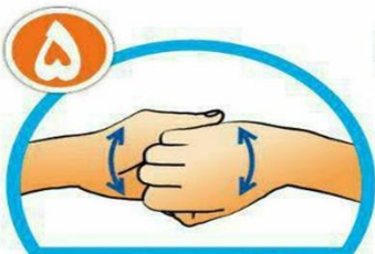
نوک انگشتان را در هم گره کرده و به خوبی بشویید.