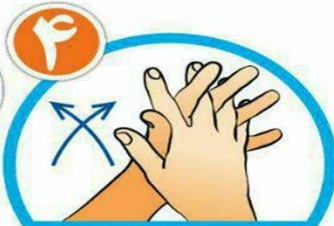
بین انگشتان را از روبرو بشویید.