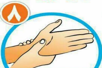
دور مچ هر دو دست را بشویید.